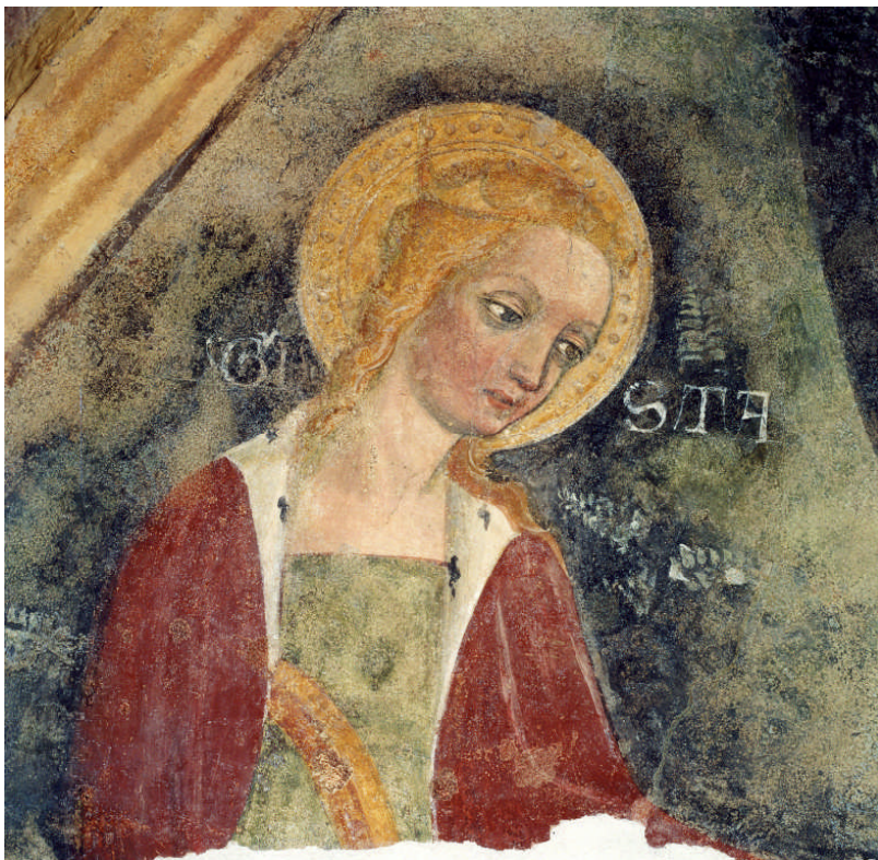
Храм Святої Августи, каплиця мученика: Свята Августи в акті слухати група віруючих молитися. XV столітті фрески (деталь).