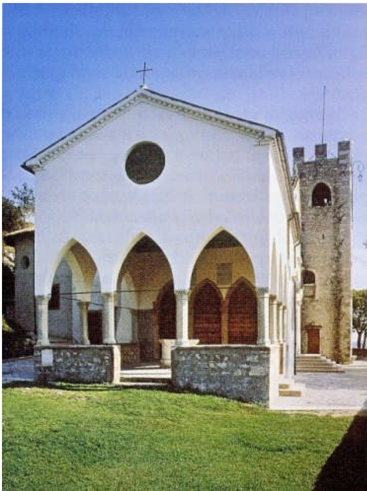
Храм Святої Августи. Лоджія перед входом у древній храм, побудований у розширенні роботи (1450-1452).

Matrusso довелося проковтнути першої поразки. Давши волю гнів довгий лайки і погроз, він наказав охоронцям закрити в'язницю Августу.