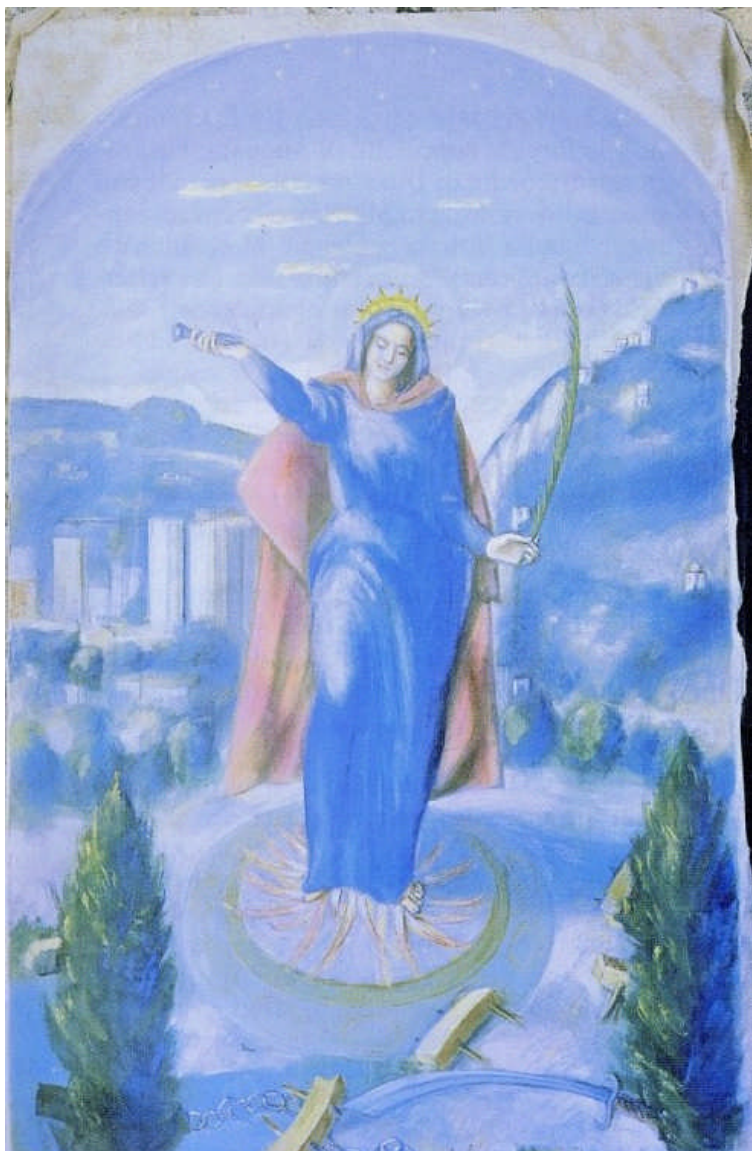
Луї Сілло. Святої Августи в Серравалле і "Конкордія-штаті Санта-Катаріна, Бразилія. Полотно, олія. 1999.